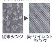
従来シンク 美・サイレントシンク