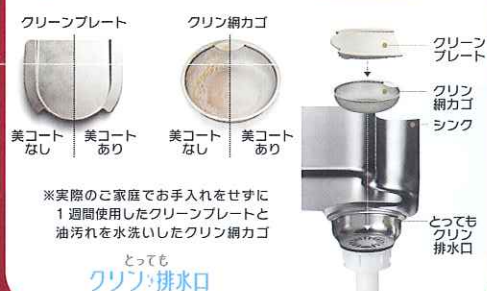
美コートなし 美コートあり 美コートなし 美コートあり

※実際のご家庭でお手入れをせずに1週間使用したクリーンプレートと油汚れを水洗いしたクリン網カゴ